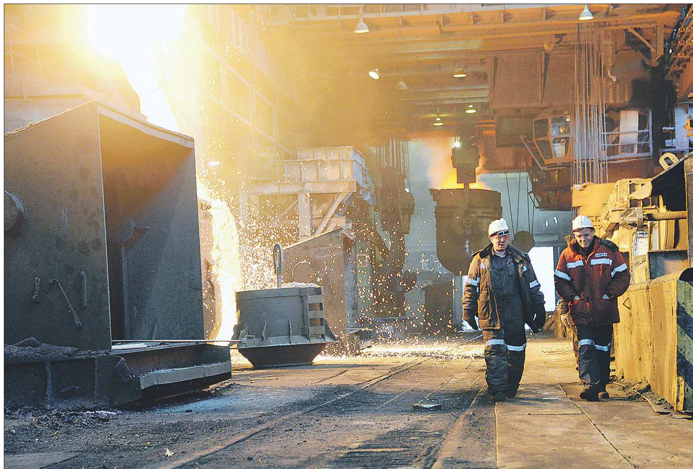
Одна из самых современных установок НТМК — печь-ковш — выполнена в Европе. Удастся ли нашим производителям создать для неё комплектующие?

Большая часть этой продукции до последнего времени привозилась издалека. Среди поставщиков немало зарубежных фирм, в том числе украинских. Падение рубля, а также политическая обстановка в мире заставили тагильских металлургов изменить географию поставок и поискать партнёров по соседству. Сейчас среди по-