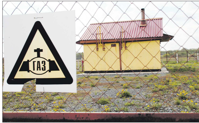
На Среднем Урале газопровод проведён в 341 населённый пункт из 1910, но подключён к нему в лучшем случае каждый третий дом

Вот и получается, что голубое топливо есть, труба прямо под окнами, а люди всё равно сидят на дровах.