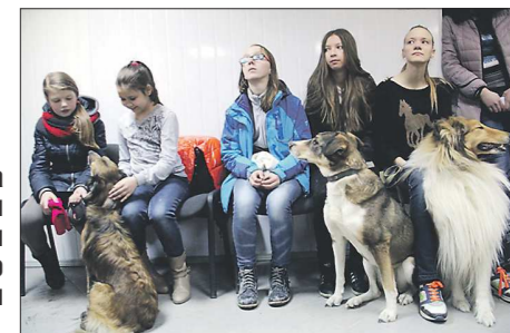
Тренировки по аджилити, подготовка собак к выставкам, уход и воспитание — по всем вопросам березовчане теперь могут советоваться с опытными заводчиками.

На открытие клуба пришли в основном школьники и студенты вместе со своими питомцами