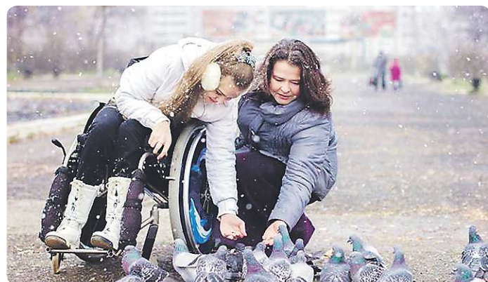
Свободного времени у Каминских не много, и они предпочитают проводить его вместе