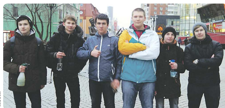
Участники молодёжного движения против курения в общественных местах говорят, что нарушители обычно тушат сигареты, когда они их об этом просят...

В России уже несколько лет как вступил в силу закон о запрете курения в общественных местах. Однако, несмотря на табу, многие курильщики продолжают «дымить» повсеместно. В связи с этим в Екатеринбурге, как и во многих других городах страны, начали появляться общественные молодёжные организации, которые пытаются бороться с нарушителями. Корреспондент «НЭ» поговорила с участниками подобного движения в столице Урала.