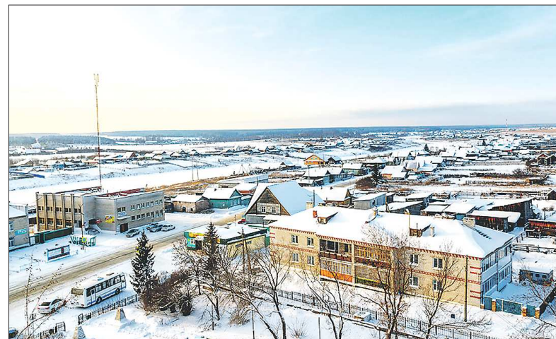
Село Покровское Артёмовского ГО отличается своей протяжённостью — длина местной улицы Ленина превышает 7 километров, по ней проходит областная трасса