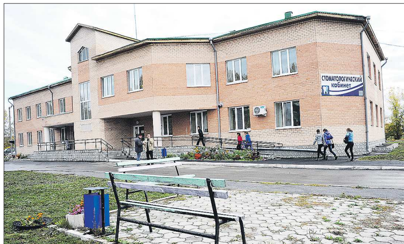
В селе Покровское Каменского ГО есть целый больничный городок, самый новый корпус которого начали строить в 2000 году. Правда, первых пациентов он принял только в 2010-м