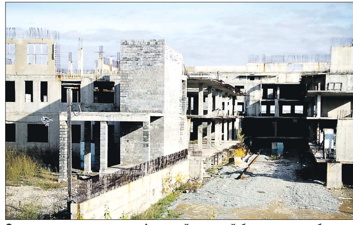
Строительство многопрофильной детской больницы, на базе которой в будущем хотят сосредоточить всю тагильскую педиатрию, началось ещё в 1995 году и за 20 лет практически не продвинулось