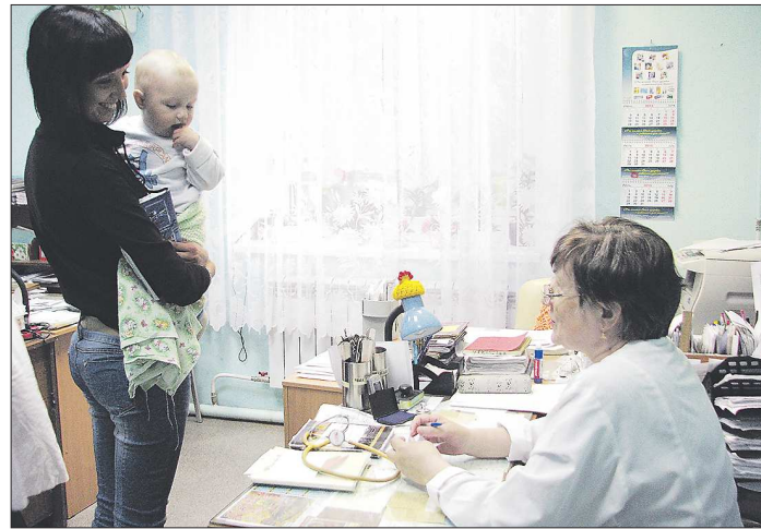
Сейчас к профильным детским специалистам тагильские мамы вынуждены ездить в разные больницы