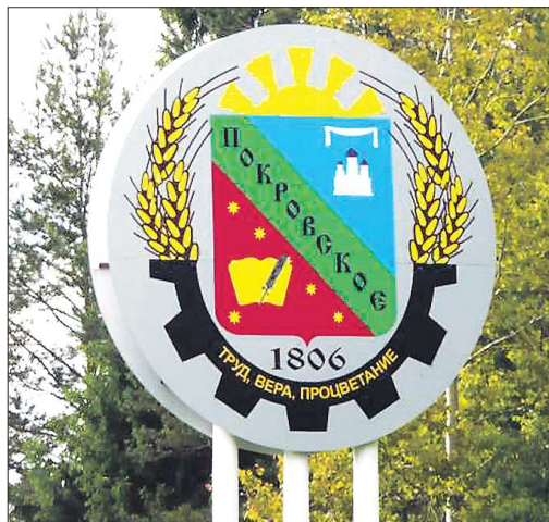
На въезде в село Покровское Горноуральского ГО пару лет назад появилась стена, выполненная по эскизу местной школьницы