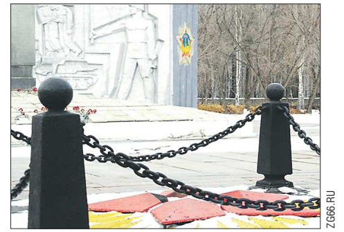
9 Мая у мемориала в Берёзовском зажётся Вечный огонь. Новую магистраль подключили к действующей газовой трассе на улице Спортивной

Подрядчик закончил монтаж газопровода, подводящего газ к Вечному огню на мемориале боевой и трудовой доблести берёзовчан.