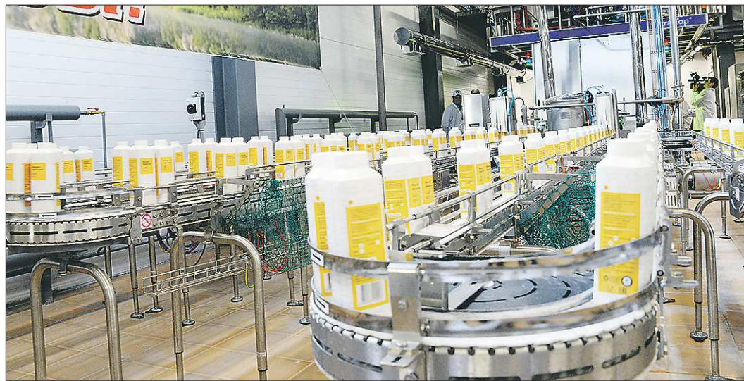
В новом цехе будут производиться пастеризованное молоко, кефир, ряженка, снежок, фруктовый питьевой йогурт, ацидофилин, молочно-соковые коктейли, обогащённые витаминами

Открывая заседание Совета по реализации приоритетного национального проекта «Развитие АПК», губернатор рассказал о том, как выполняется в нашей области эта программа. За последние два года объём производства в сельском хозяйстве вырос на 26 процентов. — Мы должны дать фермерам возможность без проблем сбывать свою продукцию, — подчеркнул Евгений Куйвашев. — И будем всячески поддерживать инициативы нашего агропрома, принимая решительные меры по привлечению заёмных средств и инвестиций в этот сектор. Проблем у уральских крестьян нынешней весной немало. Кое-что осталось в наследство от прошлой ранней зимы. Октябрьский снег не дал вспахать все земли, отведённые под зябь. Нагрузка на технику будет очень высока: во-первых, её у нас не так уж и много, а во-вторых, сроки для посевной на Урале слишком коротки. Успеть нужно всего за пару недель. Но главная проблема накануне посевной — это кредиты. Во-первых, банки дают их под 23–25 процентов, во-вторых, и на этих условиях деньги по-