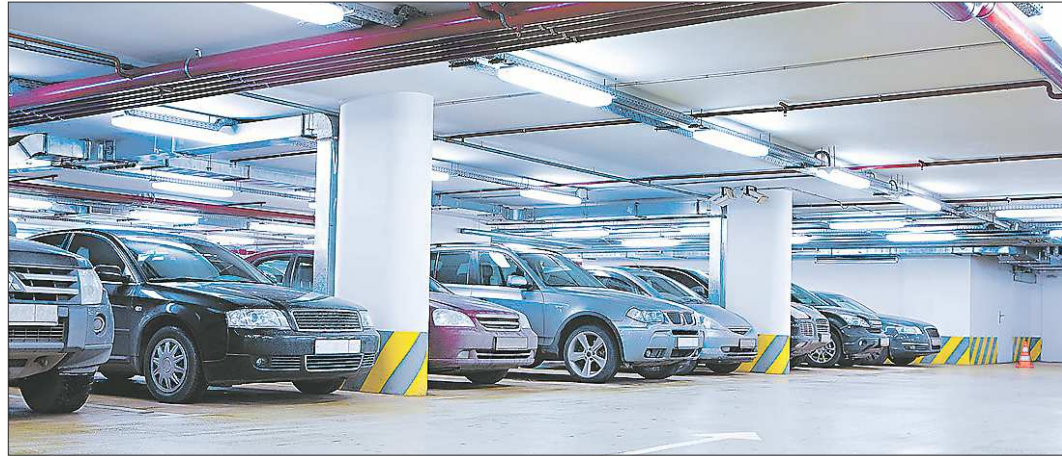
Новый двухуровневый подземный паркинг на ул. Татищева сможет вместить около пяти сотен машин

Всего на подготовку города к чемпионату мира планируют потратить 35 миллиардов рублей. 62 процента от общей суммы выделит областной бюджет. И лишь 12 процентов — федеральный центр.