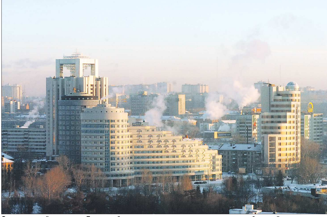
Смог, который повис над Екатеринбургом в начале марта, установил своеобразный рекорд последних лет по продолжительности

Уже который год подряд весна в уральской столице — это прежде всего грязь, пыль и смог. Специально для этого времени года местные жители придумали Екатеринбургу ироничное название — «Грязьбург». Однако ситуация далеко не шуточная. По сообщению Роспотребнадзора, суммарная атмосферная нагрузка в городе на сегодняшний день равна пяти баллам, то есть воздух загрязнен настолько, что может быть опасен для здоровья горожан. «ОГ» попыталась разобраться, почему грязь стала символом столицы Урала и когда в Екатеринбурге можно будет вздохнуть полной грудью.