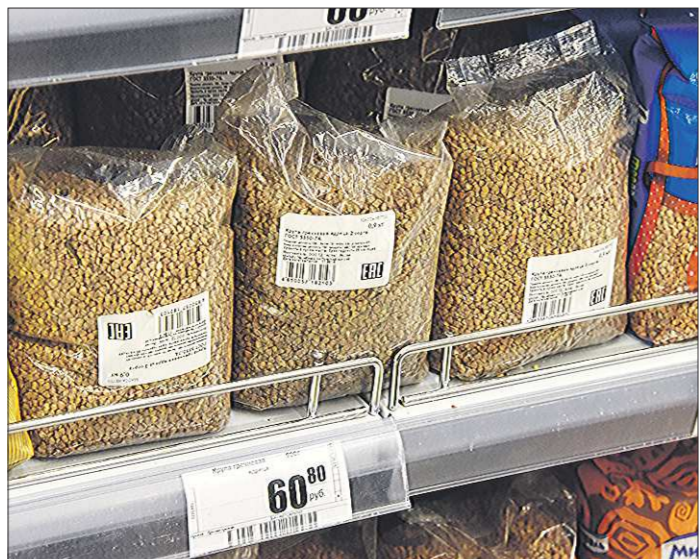
Цены на гречку, которые по осени так беспокоили покупателей, за время нашего мониторинга не выросли, и даже немного снизились

Та же безбратная статистика зафиксировала: за 2014 год порядок сократилась покупательная способность населения Свердловской области. Если сказать проще, то купить на заработанные деньги граждане могут уже несколько меньше, чем год назад. В 2014 году, по сравнению с 2013-м, снизилась покупа-