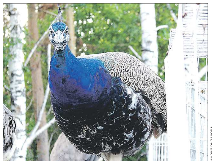
ка — в пределах 10-15 тысяч, яйцо можно продать за полторы-две тысячи.