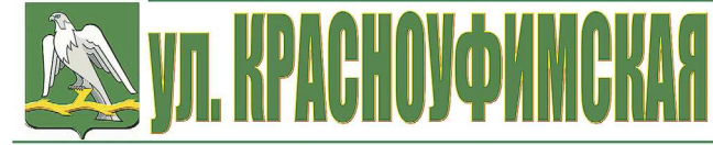
На каждой табличке помимо зелёной надписи изображён герб Красноуфимска — серебряный сокол