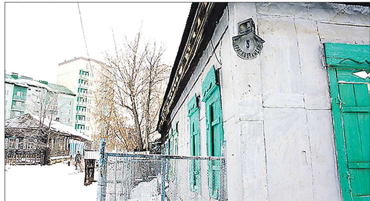
Это один из самых старых районов города, в основном там расположены частные дома