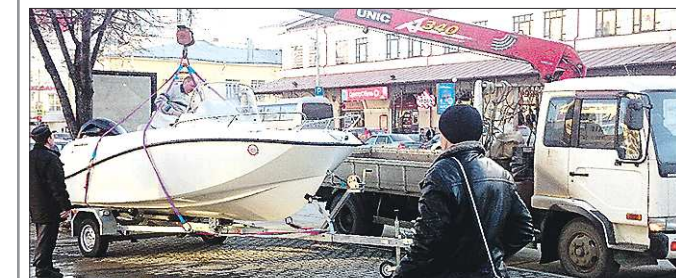
В пятницу, 20 марта, с улицы 8 Марта в Екатеринбурге эвакуировали катер. Судно находилось на причёпе, припаркованном на тротуаре возле станции метро «Площадь 1905 года». Погрузку катера заснял один из прохожих. Стоимость судна, оставленного хозяином в неположенном месте, колеблется от 800 тысяч рублей до миллиона. Владелец грозит штраф за парковку на тротуаре — одна тысяча рублей