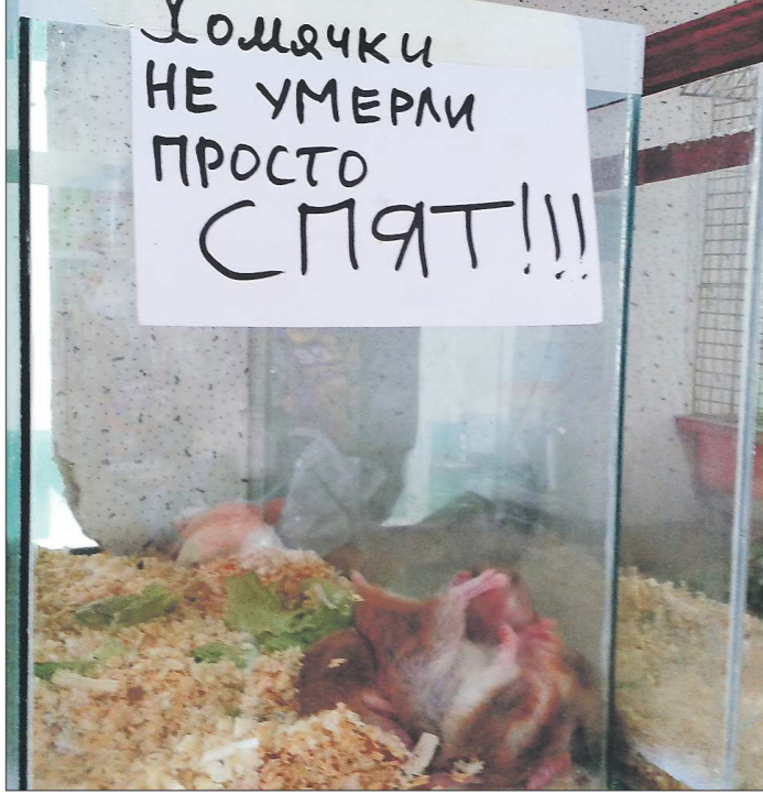
Закрывшиеся зоомагазины в Екатеринбурге раздавали хомячков даром, однако желающих безвозмездно взять грызунов практически не нашлось

Разглядывая папку одного из самых популярных сухих кормов для кошек в России. На обороте написано: «Сделано в России...» По словам Ки-