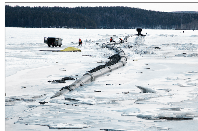
Скоро полукилометровая труба уляжется на дно водохранилища