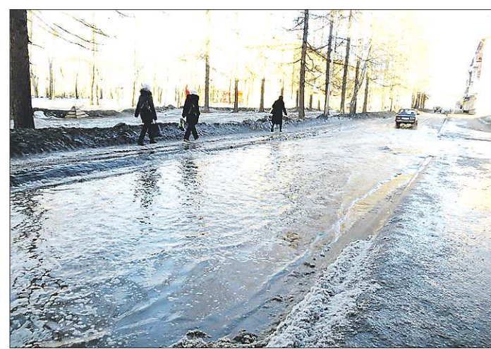
Резкое потепление превратило одну из центральных улиц Североуральска в реку