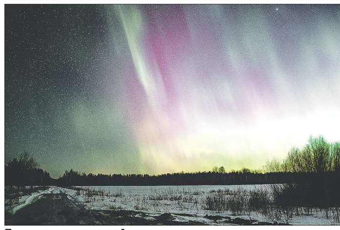
Полярное сияние под Алапаевском...