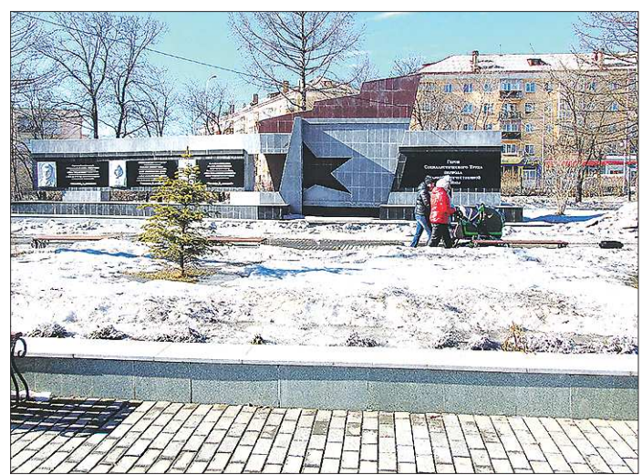
Хоть ремонт площади Славы выполнен не идеально, он превратил этот объект в самый популярный у жителей района