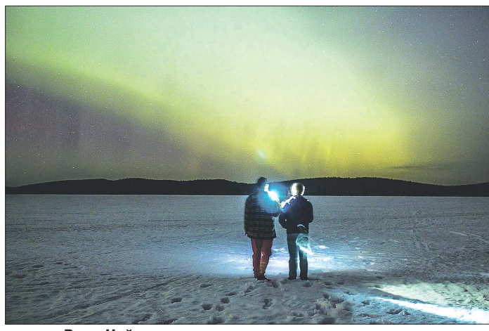
...и над Верх-Нейвинским водохранилищем