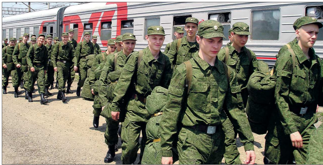
Ежегодно с областного сборного пункта Свердловской области в войска всех военных округов России уходят десятки воинских эшелонов с призывниками

— Нет, это не так. Начальную военную подготовку как отдельный предмет обучения из школьных программ действительно исключили более четверти века назад. Но сегодня ситуация выправляется. Обучение начальным военным знаниям в настоящее время осуществляется в нашей стране в соответствии с федеральными законами «О воинской обязанности и военной службе» и «Об образовании». В программах предмета «Основы безопасности жизнедеятельности» для средних школ и образовательных учреждений начального и среднего профессионального образования есть разделы «Основы военной службы». А в учебных пунктах организаций военного комиссариата Свердловской области изучение основ военной службы выделено в отдельный предмет.