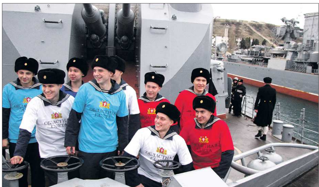
Уральские матросы «Сметливого», которым «ОГ» подарила свои фирменные футболки, ждут не дожидаясь, когда их корабль, который они непрерывно делят и красят, отправится в поход