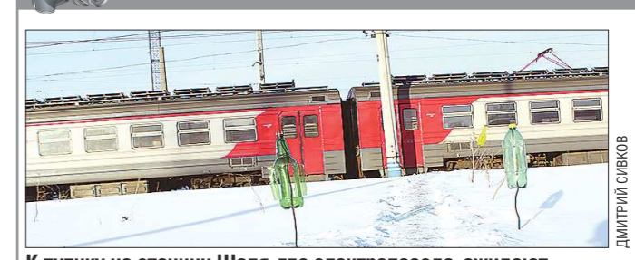
К тупику на станции Шалья, где электропоезда, ожидают выезда на посадку, ведёт тропа, обозначенная необычными габаритами. Отметать вешками тропки, чтобы не сбиться с пути, для сельских жителей дело обычное. В данном случае интересен способ: на воткнутые по краям тропы ветки надевают пластиковые бутылки, в которых вырезаны лопасти. Получились своего рода вертулки — и путь укажут, и погребят — хоть на слух иди. На станции Шалья сообщили, что официальных маршрутов в этом месте нет, и скорее всего это выдумка машинистов, работающих на обогреве локомотивов