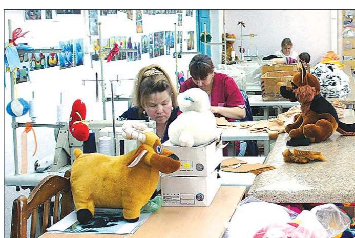
В былые времена в Невьянке было училище, которое готовило гончаров и швей, поэтому с поиском кадров у предпринимателей проблем не возникло