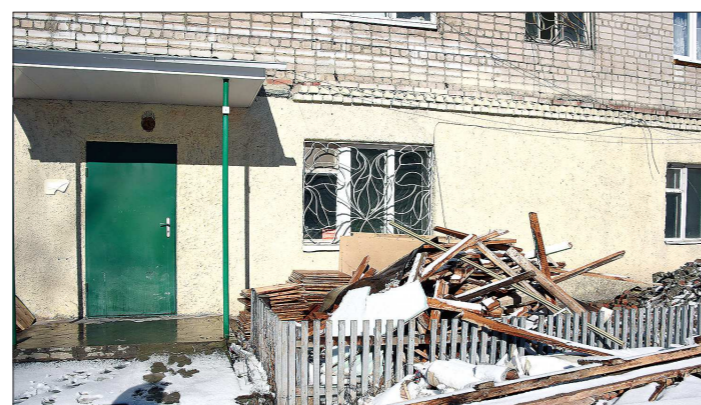
С апреля режевской загс будет располагаться в цокольном этаже обычной пятиэтажки.