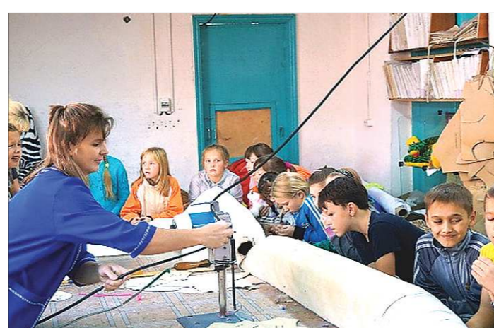
Фабрику игрушки включили в туристическую карту Невьянска, теперь сюда постоянно прибывают детские и семейные группы. Никто не уходит с пустыми руками: дети делают для себя мягкие сувениры