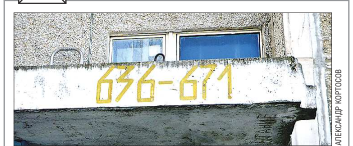
В доме на Черепанова 671 квартира, на Сыромоловой на 10 меньше, поскольку в доме несколько арок