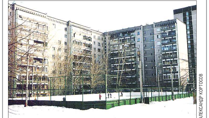
Согласно картам, дом по Черепанова, 12 (на фото) на несколько метров короче дома по Сыромоловой, 7 — 507 метров против 515. Кроме того, в Книге рекордов речь шла о самом длинном жилом доме, а пристрой — это не жилые помещения, квартал в нём нет