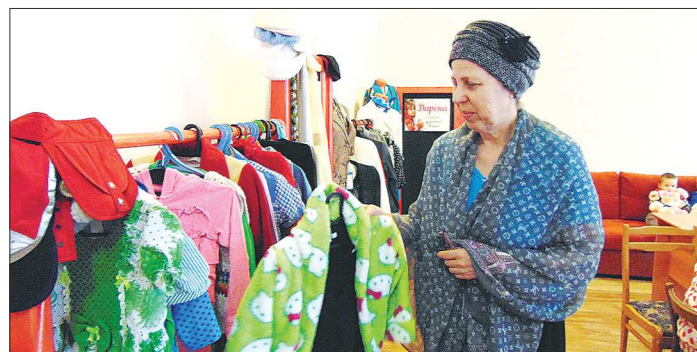
В салоне на общественных началах работают прихожанки тагильских храмов