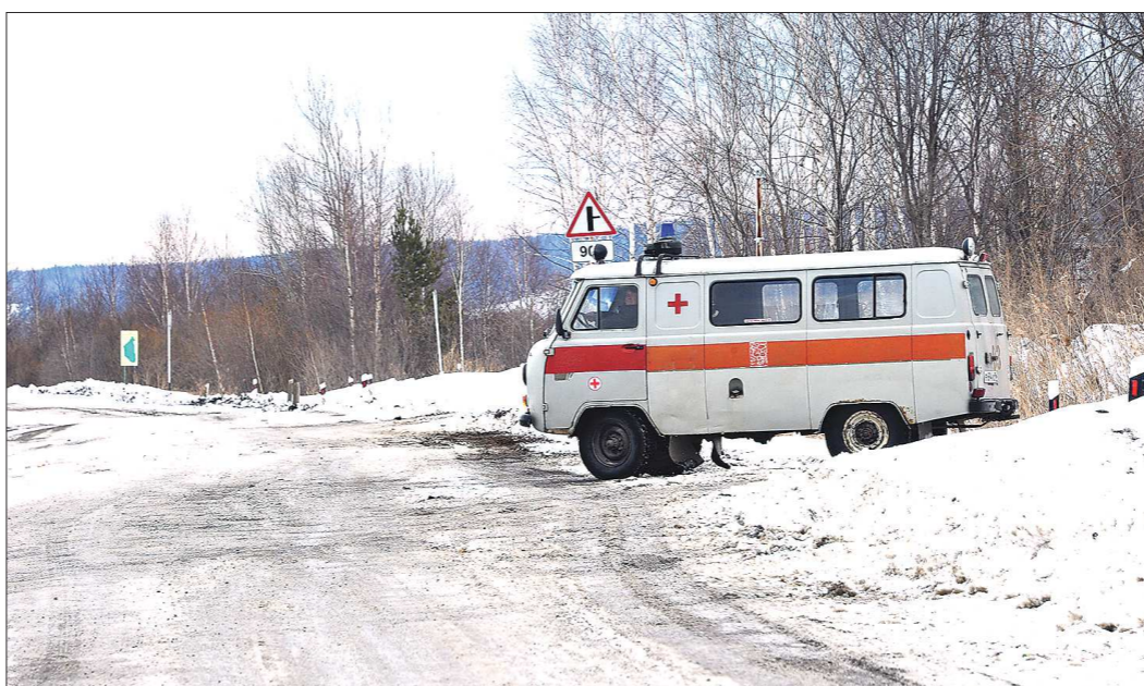
В махнёвской «скорой помощи» в четыре смены работают 16 человек, включая водителей и диспетчеров

Оптимизация учреждений здравоохранения приобретает такие масштабы, что болей становится просто страшно — в случае чего, врач можно не дожидаться.