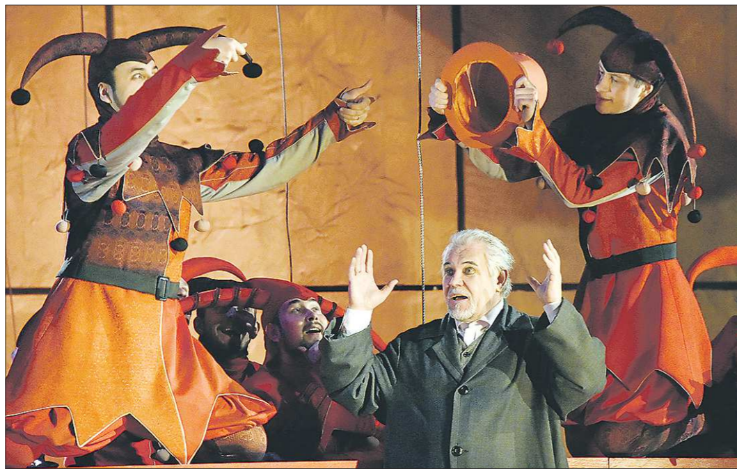
Нет, «Риголетто» в этой трактовке — уже не просто история отца и дочери...

— В этом проекте я занял сложную позицию нигилиста-романтика. С одной стороны, в