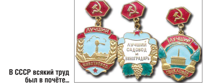
В СССР всякий труд был в почёте...

Всего на выставке представлено более 500 знаков отличия, которые в разное время выдавали 17 общественных организаций страны. Самый старый экспонат датируется 1923 годом. Есть также малоизвестные современному человеку знаки «Будь готов к санитарной обороне СССР», «Лучший свекловод», «Друг детей».