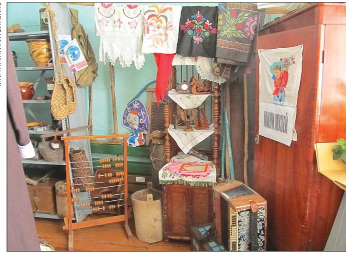
Старинные вещицы в библиотечном музее вызывают большой интерес у школьников