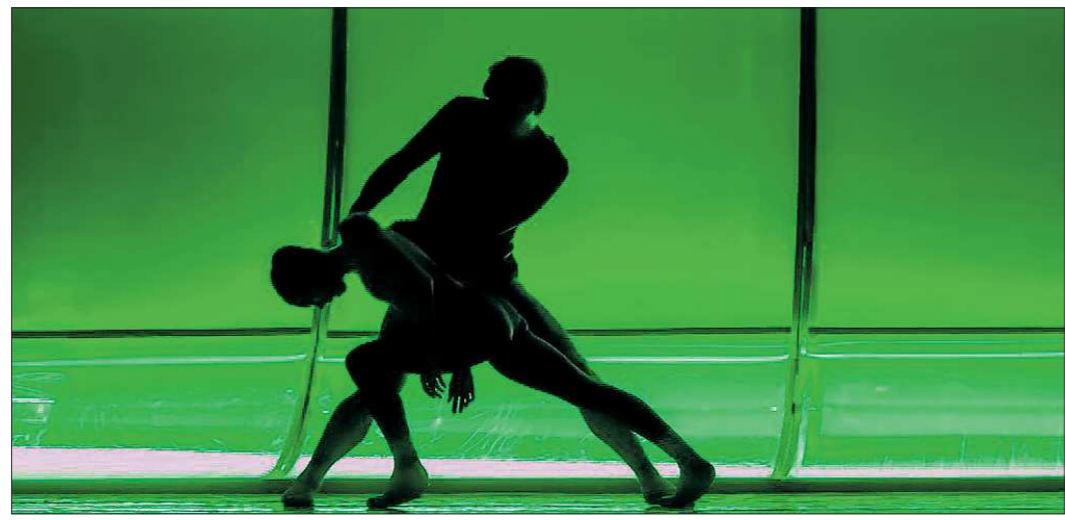
«Цветоделику» покажут на всю страну

Постановка Екатеринбургского театра оперы и балета вошла в четвёрку спектаклей «Золотой Маски», которые покажут на всю страну. Телетрансляция в прямом эфире будет вестись 11 апреля прямо из зала московского театра «Новая опера», а посмотреть её можно будет в нескольких кинотеатрах Екатеринбурга. Цена билета составит 500 рублей. Помимо столицы Урала, в проекте также участвуют более 35 городов России. Напоминаем, что «Цветоделика» выдвинута на «Золотую Маску» в четырёх номинациях