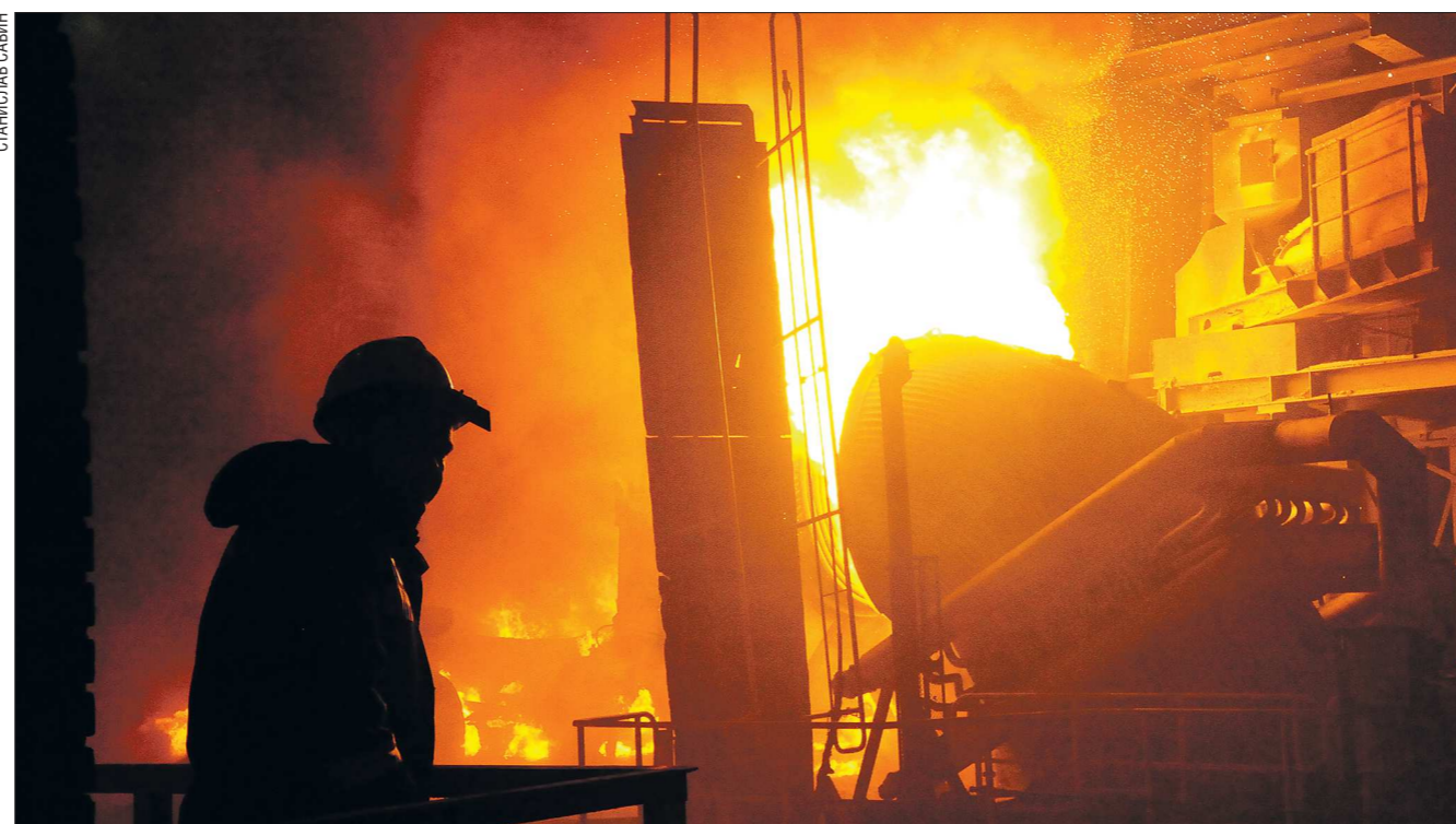
Главная отрасль Среднего Урала — металлургия. А металлургия — это и есть химия, только высокотемпературная