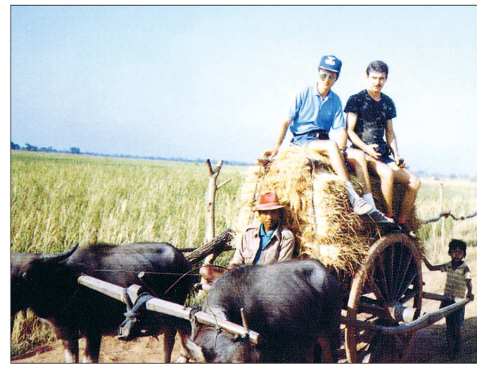
В Камбодже до аэродрома приходилось добираться и таким транспортом

– А где любите проводить отпуск? – В Краснодарском крае.