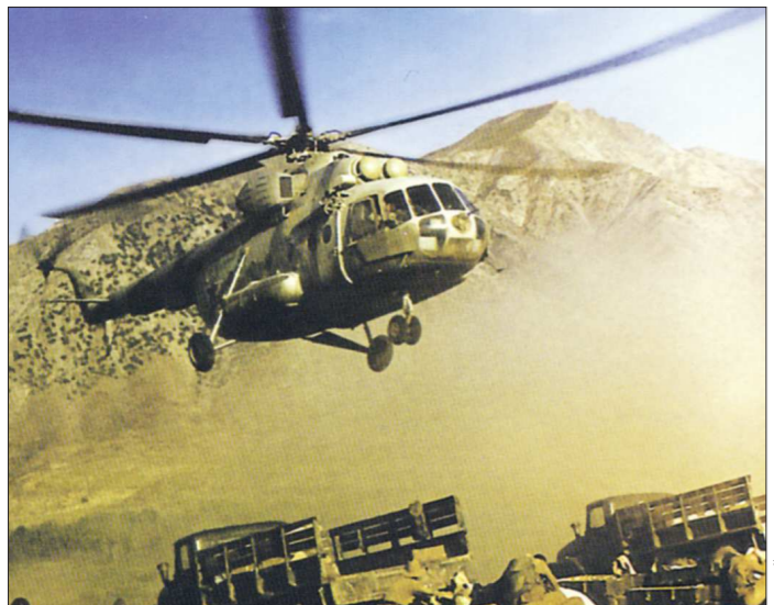
Над вершинами Кавказа. 1995 г.