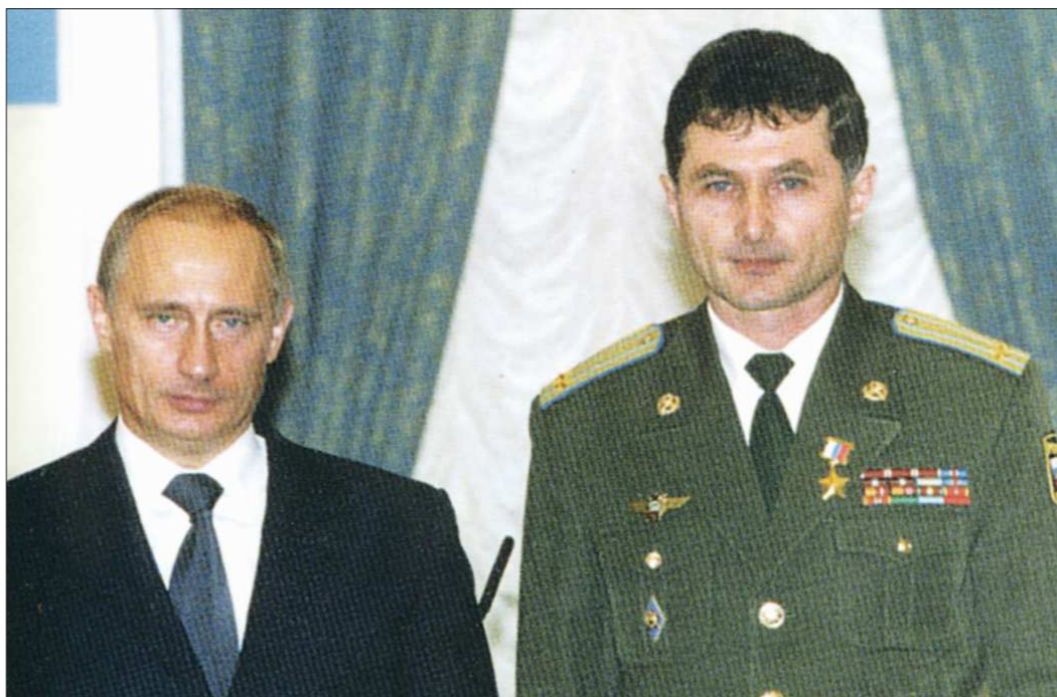
Золотую Звезду Героя России подполковнику Игорю Родобольскому вручил Президент России Владимир Путин. Москва, Кремль, 2003 г.

Но мне так понравилось летать, управляя винтокрылой машиной, что сразу после окончания аэроклуба я решил поступать в Сызранское высшее военное авиационное училище лётчиков. Его я окончил с отличием в 1983 году. Это первое и единственное в нашей стране военное учебное заведение, которое готовило и продолжает готовить вертолётчиков. По вы-