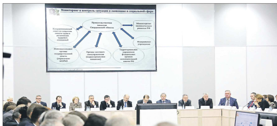
Главы муниципалитетов в ходе совещания не только обсудили стоящие перед регионом задачи, но и вкратце ознакомились с современными управленческими методиками

Новое время ставит перед каждым из нас новые задачи. Одни учатся экономить, другие — планировать будущее, третьи расставляют приоритеты так, чтобы превратить временные трудности в трамплин к дальнейшему росту.