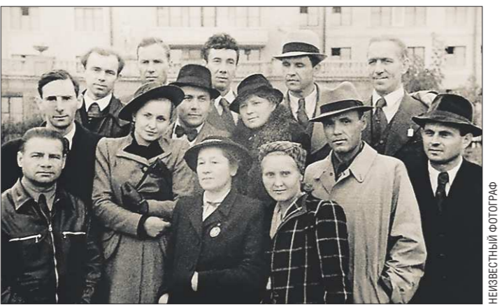
Один из экспонатов. Артисты МХАТа на фоне гостиницы «Большой Урал», где они жили

В екатеринбургском музее «Литературной жизни Урала XIX века» впервые представили широкой публике документы, отражающие жизнь актёров МХАТа во время эвакуации на Урал в 1942 году. Это перелика администраторов столичного театра с руководством области по поводу предоставления сценической площадки, а также размещения московских актёров. Документы были обнаружены в Государственном архиве области в 2014 году.