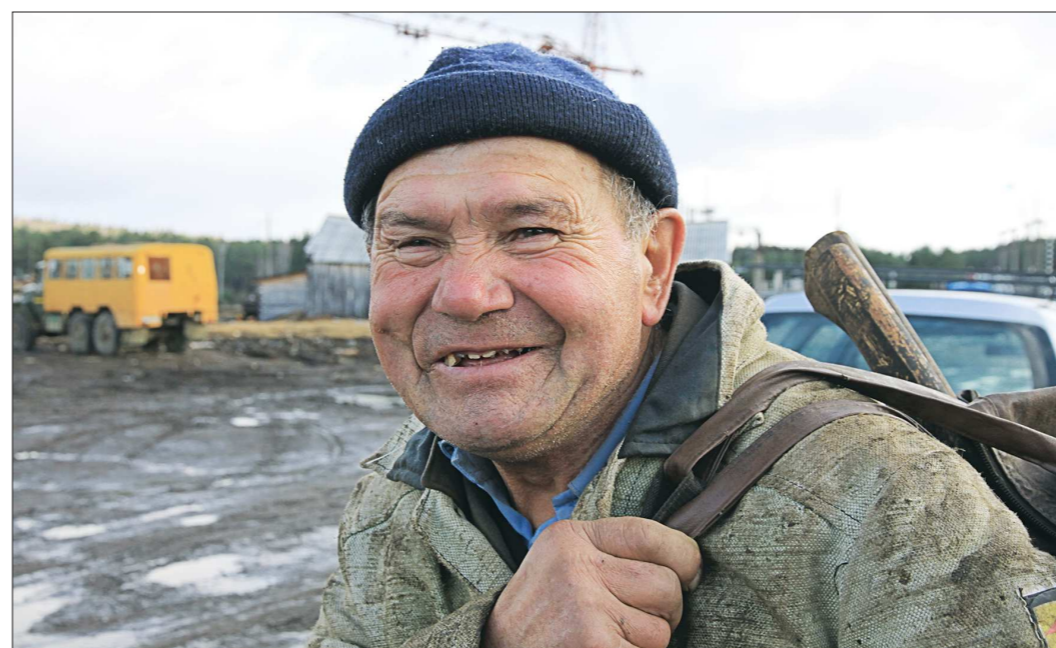
«Старый лесоруб». 2012 год, посёлок Азиатский