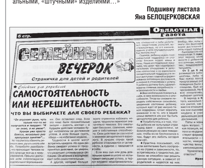
На страницах «ОГ» выходила рубрика для детей и родителей «Семейный вечерок». Здесь были и творческие задания для ребят, и конкурсы, и полезные советы для родителей.

2001. «ОГ» опубликовала серию материалов, посвящённых номинантам на губернаторскую премию и рассказывала о восстановлении уникальных фаянсовых иконостасов в Верхотурье.