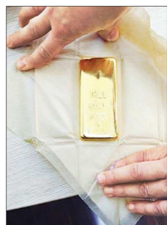
В Сбербанке процесс вскрытия ящиков с золотом снимали на видео. Затем слитки запротоколировали и заверили нотариально

— В здании Сбербанка ящики вскрыли в присутствии членов инвентаризационной комиссии. В трёх из них, как и предполагалось, были слитки металла жёл-