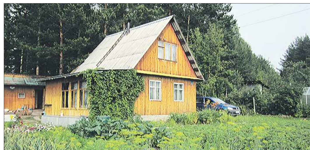
В отличие от объектов индивидуального жилищного строительства, для садовых домиков «дачная амнистия» бессрочна

Государство, убирая на время некоторые бюрократические процедуры, существенно упрощало сам процесс получения права собственности. Это было очень важно для страны, где на про-