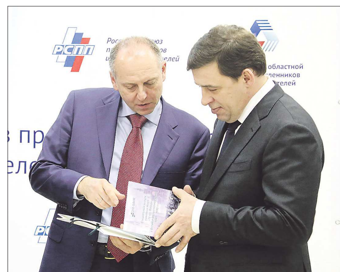
Начатый в зале разговор Дмитрий Пумпянский (слева) и Евгений Куйвашев продолжили и по окончании заседания

Открывая встречу, Евгений Куйвашев подчеркнул, что считает противодействие негативным тенденциям в экономике одной из важнейших задач руководства области. Он рассказал, что в «ручном режиме» отслеживает ситуацию на предприятиях, лично контролирует наличие заказов и оборотных средств. Проблемы уральской промышленности регулярно становятся темой его переговоров в федеральном Фонде развития промышленности. Эти усилия уже принесли первые