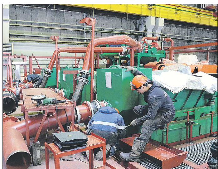
Монтаж циркуляционной системы, предназначенной для нефтяников, почти закончен. Работа в одном из цехов УЗТМ идёт в две смены. Успеть нужно точно в срок

Сегодня, когда санкции заставили многие отрасли промышленности обратиться к услугам внутреннего рынка, самое время нашим предприятиям осваивать новые виды продукции. Но не тут-то было. Для расширения производства, на покупку новых линий нужны деньги. А доступ к дешёвым западным кредитам закрыт теми же санкциями. Мало того, как только рынок начинает лихорадить, страдает платёжная дисциплина, и покупатели берут бесконечные отсрочки платежей, не торопятся гасить долги за поставленные уже товары. Между тем деньги на производство и комплектующие потрачены, другие партнёры