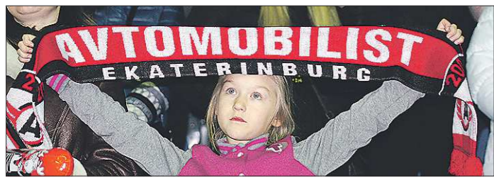
«Автомобилист» ещё ни разу не преодолевал барьер первого этапа плей-офф. Может быть, в этом году они смогут порадовать болельщиков?