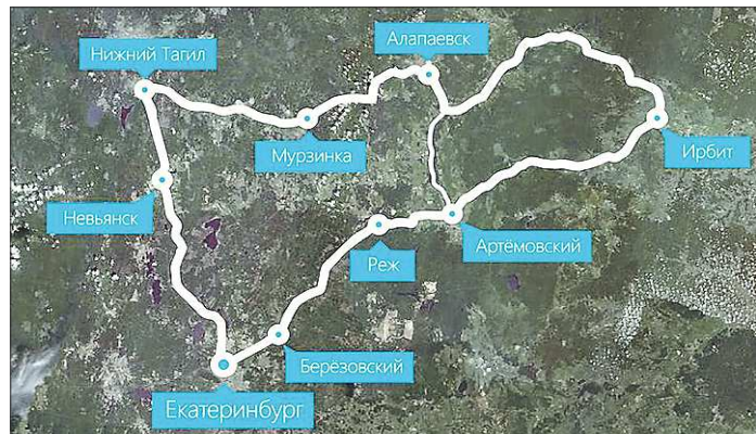
Маршрут «Самоцветное кольцо Урала», протяжённостью 630 километров, проходит по территории более чем десяти муниципальных образований

плексной программы планируется актуализировать средства федерального, регионального и местных бюджетов, а также внебюджетные средства.