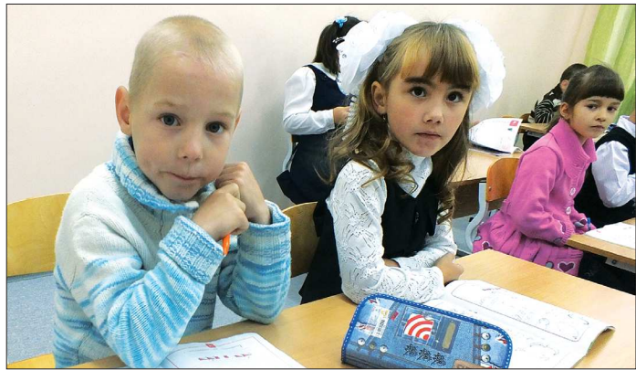
Для ученика важна не престижность школы, а то, насколько внимательны к нему учителя