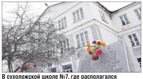
В суходоложской школе №7, где располагался госпиталь, к 70-летию Победы планируют открыть уголок, посвященный истории знаменитого в городе шахматного клуба