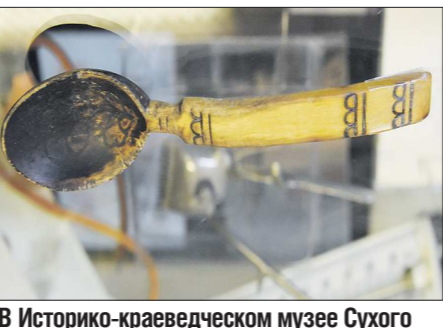
В Историко-краеведческом музее Сухого Лога по сей день хранится та самая деревянная лажечка, которой медсестра выкормила солдата