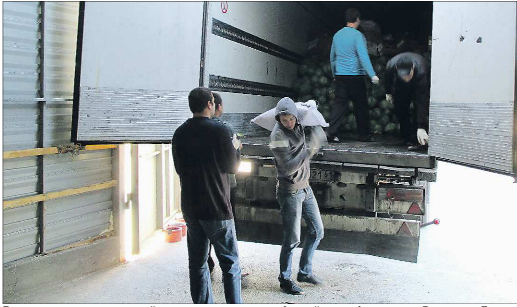
Гуманитарные грузы со всей страны поступают на сборный пункт батальона в Ростов-на-Дону, там их загружают в КамАЗы и везут на юго-восток Украины