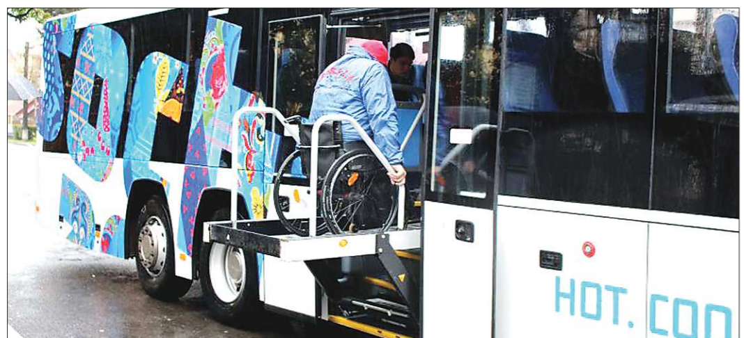
Автобусы для междугороднего перемещения людей с ограниченными возможностями впервые стали широко использоваться на зимних Олимпийских играх в Сочи. Затем аналогичный транспорт начали поставлять в другие регионы страны

В рубрике «Дело за малым» мы рассказываем о людях из небольших населённых пунктов, которые ведут свой маленький бизнес и стали незаменимыми для земляков