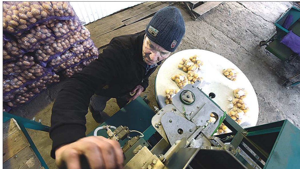
Производительность фасовочной линии — 15 тонн за восьмичасовую смену, но на такие объёмы курьинцы пока не вышли

Благодаря его инициативе в Курьях появились шесть но-