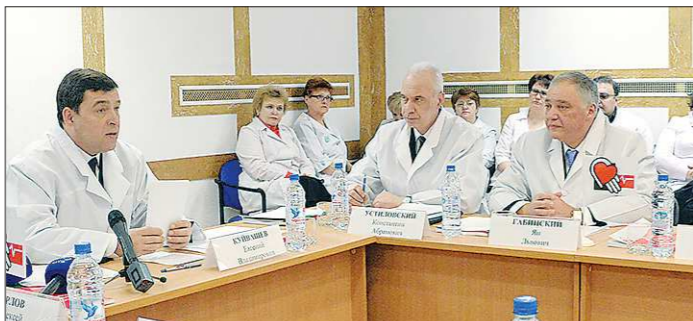
Евгений Куйвашев (слева) обсудил с участниками совещания и возможность оформить для жителей области коронарные паспорта, которые помогут контролировать здоровье граждан

Как превратить Средний Урал в «Территорию здоровых сердец»? Ответ на этот вопрос губернатор Свердловской области обсудил вчера на совещании в екатеринбургском кардиоцентре.