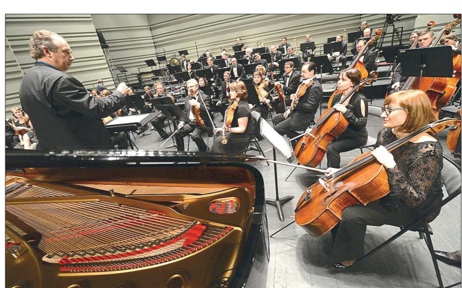
Уральский академический филармонический оркестр впервые выступил на фестивале «Безумный день» в Нанте в 2010 году