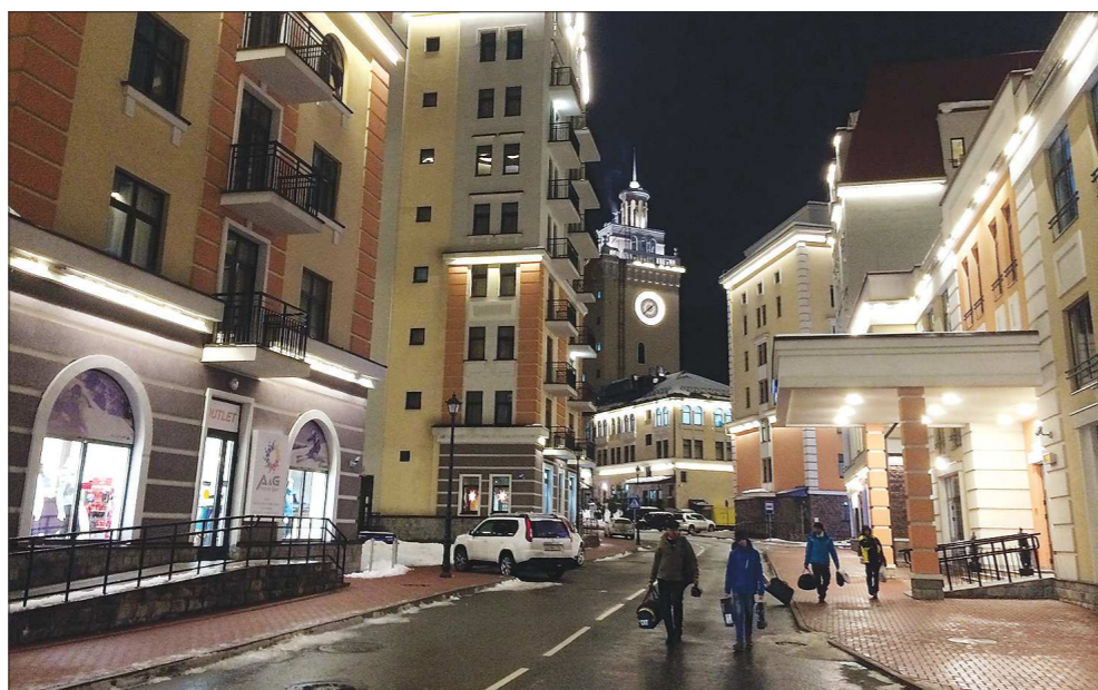
На «Розу хутор» туристы приезжают гулять по вечерам. Здесь сосредоточены бары, рестораны и магазины. А ещё очень красиво и чисто

ли в Эсто-Садке. Фактически это частный сектор, но ходить по нему не страшно даже в тёмное время суток — ухоженные домики, в каждом втором — мини-гостиницы, хорошее освещение, чисто (удивительно, но за неделю проживания мне ни разу не пришлось мыть обувь). Как рассказывают сочинцы, собственникам жилья, расположенного на виду, перед Олимпиадой настоятельно рекомендовали привести в порядок дома и заборы, для этих целей даже выдавали краску.