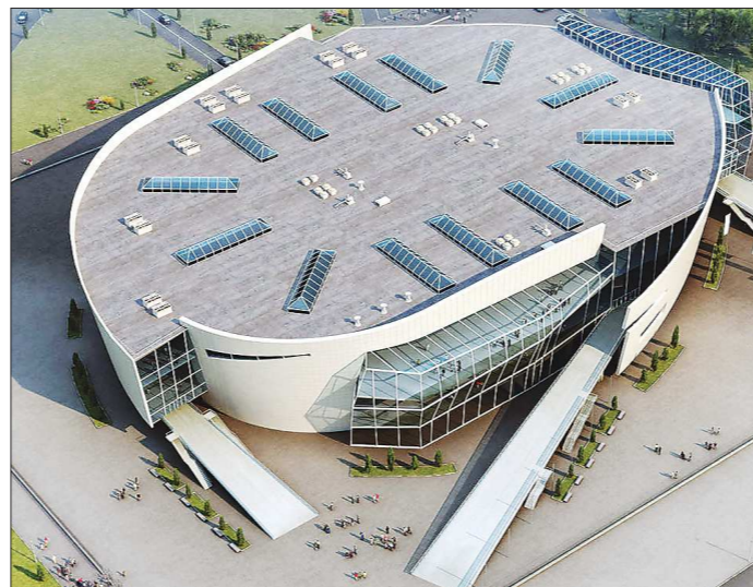
В июле 2014 года в построенной «УГМК-холдингом» в Сочи ледовой арене «Шайба» открылся Всероссийский детский спортивно-оздоровительный центр

Место: Олимпийский парк. Владелец: Центр «Омега». Стоимость строительства: 32,8 миллиона долларов. Построен: 2012. Вместимость: 8 000. Что проходило: соревнования по конькобежному спорту.