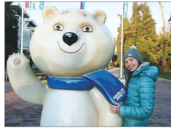
Олимпийского мишку в Сочи можно встретить почти в каждом туристическом месте

любительского биатлона на олимпийском лыжном комплексе, сходить в аквапарк на «Газпроме» (стоит он, кстати, 1000 рублей за целый день), съездить в Сочи и погулять в олимпийском парке, а ещё лучше взять там напрокат велосипед (150 рублей в час — цена вновь ничуть не удивляет) и объехать парк хотя бы пару раз. Потом свернуть на набережную, удивиться безукоризненным велодорожкам, классным уличным граффити, сюжеты которых тоже связаны со спортом, доехать до границы с Абхазией, посидеть на одной из множества скамеек на берегу моря и пожелать, чтобы на нашем веку Россия приняла ещё одну Олимпиаду.