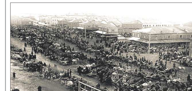
Ирбитская ярмарка — самая «долгоживущая» ярмарка России: она проводится более 300 лет