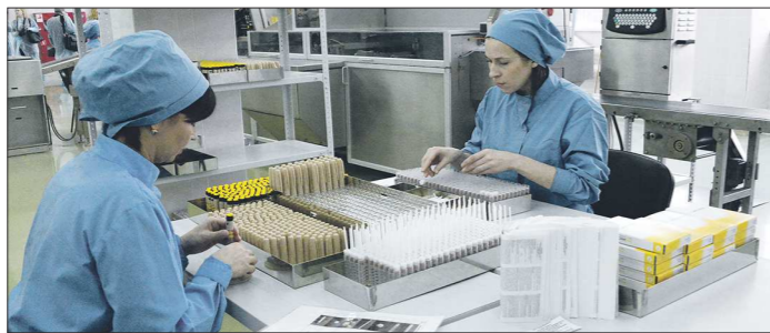
Запуск в производство новоуральского инсулина позволил снизить среднерыночную цену на это лекарство на 30 процентов

Уникальный технопарк, главная задача которого — производство современных качественных лекарств, открыли вчера в Новоуральске губернатор Свердловской области Евгений Куйвашев и депутат Государственной думы, член комитета по охране здоровья, председатель совета директоров холдинга «Юнона» Александр Петров.