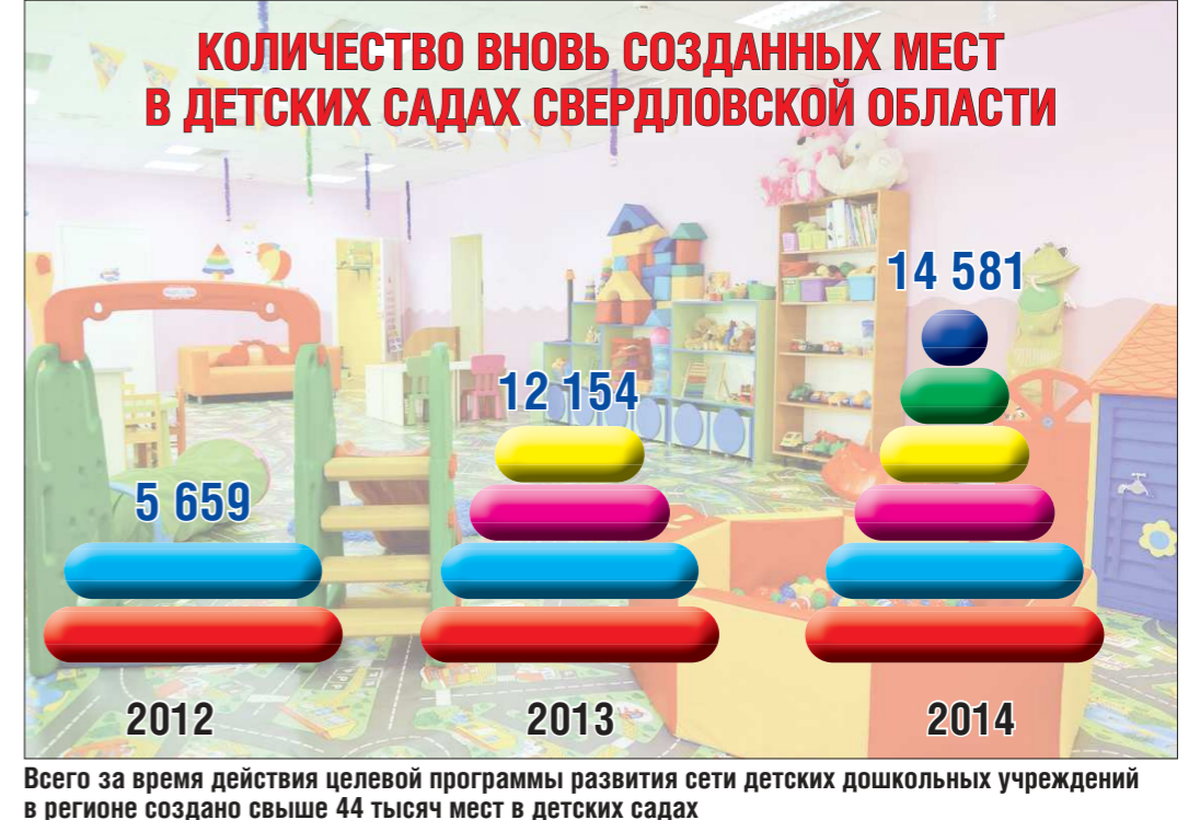
Всего за время действия целевой программы развития сети детских дошкольных учреждений в регионе создано свыше 44 тысяч мест в детских садах

— Это федеральная структура, и, безусловно, она включена в план приватизации. Мы писали соответствующие письма главе российского правительства Дмитрию Анатольевичу Медведеву. Наше предложение о создании здесь кластера было поддержано. Мы тоже заинтересованы в том, чтобы киностудию сохранить. Проведём соответствующие встречи, консультации, посмотрим, как будет развиваться ситуация. Но, по-