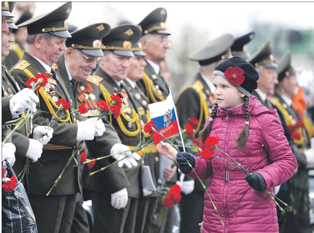
Цветы на День Победы — это очень приятно. Но пособие лишним тоже не будет