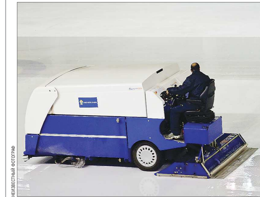
До изобретения ресурфейсеров заливка льда проводилась вручную. Первый автоматический «ледовый комбайн» появился в 1949 году. Его придумал житель Калифорнии Франк Замбони

ло не покажется. Кстати, первые шайбы были из дерева.