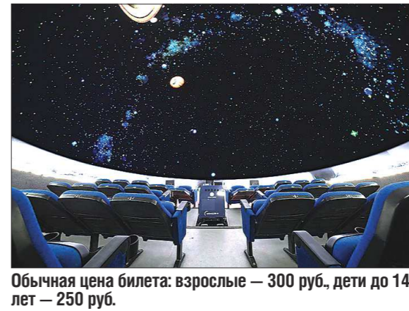
Обычная цена билета: взрослые — 300 руб., дети до 14 лет — 250 руб.

Впрочем, эксперимент так и останется экспериментом, полностью переходить на подобную систему планетарий не намерен. Но через некоторое время организаторы обещают провести ещё один подобный день, и в перспективе сделать это постоянным явлением.