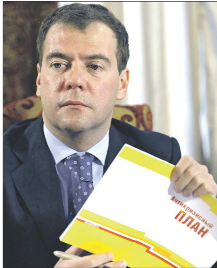
Антикризисный план, который утвердил Дмитрий Медведев, был поддержан Советом Федерации

В срок исполнить госзаказ и избежать проблем, связанных с перепадами курсов валют, поможет предрейтат от 80 до 100 процентов от суммы договора в рамках гособоронзаказа. Конечно, потратить эти деньги на дру-