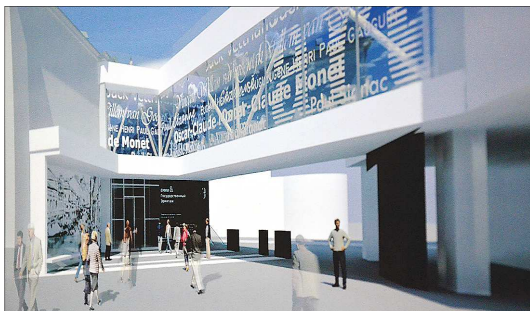
Макет пристроя, который должен появиться с южной стороны музея ИЗО

екта мы комплексно подошли к решению поставленной задачи. С одной стороны, мы решаем вопрос создания образовательного и культурного центра «Эрмитаж-Урал», с другой — проблему с фондохранением, которое может разместиться на улице Вайнера, 16, где,