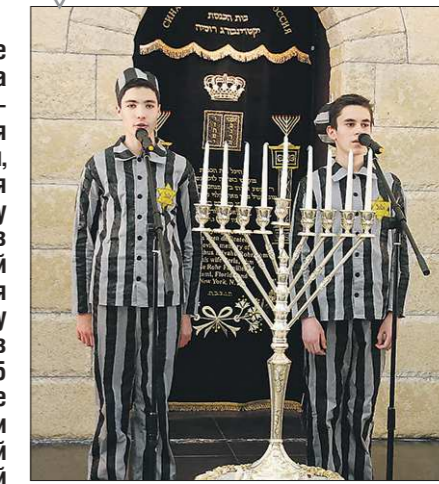
«Почтили память жертв холокоста»

Вчера в Екатеринбурге прошла торжественная церемония, посвящённая Международному дню памяти жертв холокоста, который отмечается 27 января, потому что именно в этот день в 1945 году советские войска освободили крупнейший гитлеровский концлагерь Освенцим