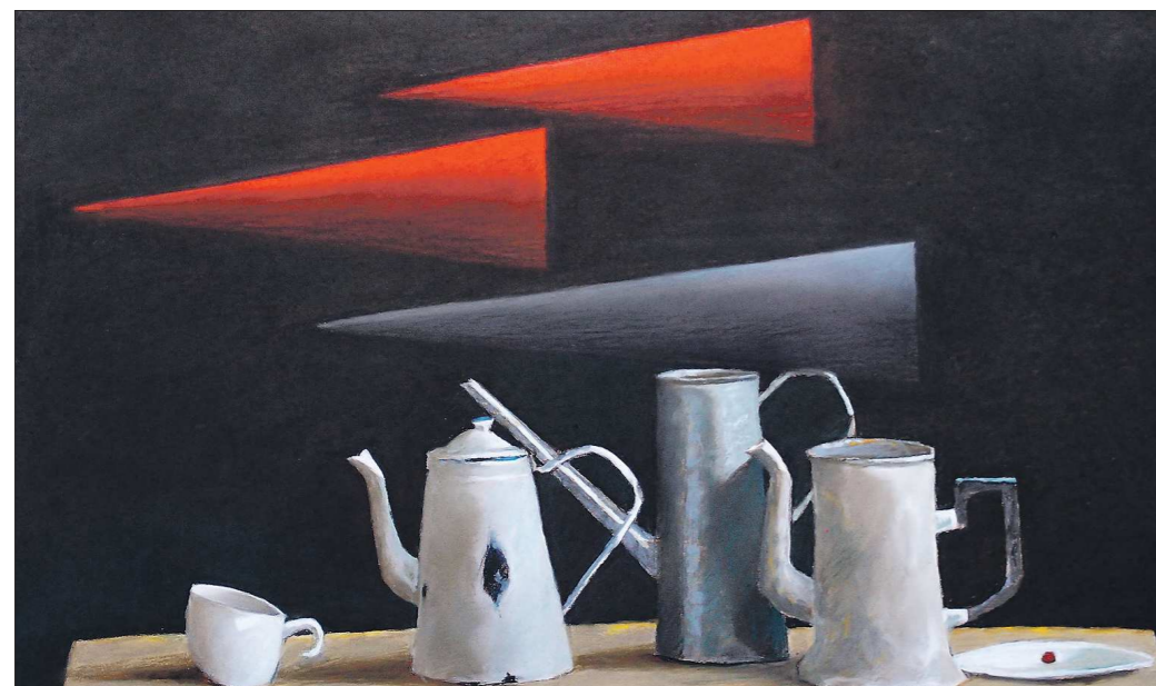
«Динамика» (Из серии «Ностальгия»)