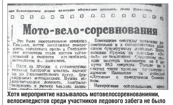
Хотя мероприятие называлось мотобусовыми соревнованиями, велосипедистов среди участников ледового забега не было