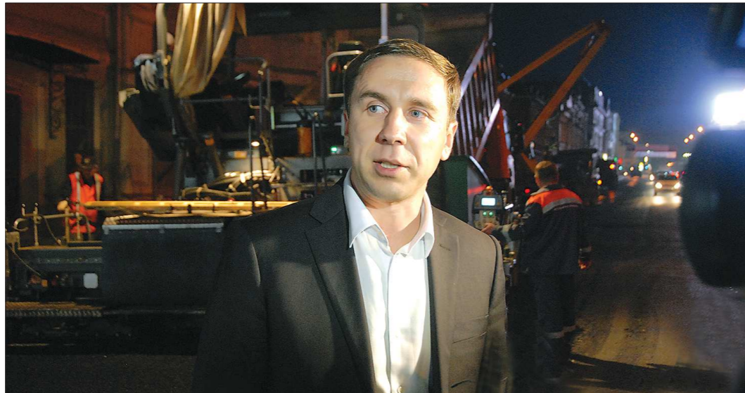
Министр транспорта и связи Свердловской области Александр Сидоренко: «Развитие дорожной инфраструктуры в Свердловской области будет продолжено»

— Да, и в этом отношении сделано немало. Так, в Екатеринбурге в этом году состоялось долгожданное для города событие — введена в эксплуатацию многорукавная развязка на пересечении улицы Московской и Обьездной дороги. Развязка построена по типу «полный клеверный лист» и рассчитана на перспективную интенсивность