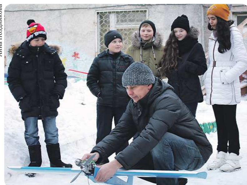
В клубе шутят, что увлечение авиамодельным спортом передаётся по наследству. Чаще всего от отца к сыну

Любителям радиоуправляемых самолётов больше не придётся запускать свои летательные аппараты с балконов советских квартир. На этой неделе в Екатеринбурге открылся Уральский клуб авиационных радиоуправляемых моделей «Шершни», где каждому пилоту выделят полосу для взлёта и посадки, а также целое помещение для техобслуживания личного парашюта.