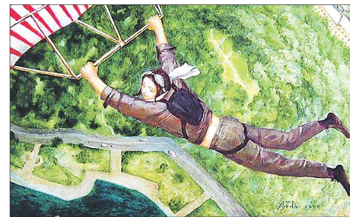
«Почти свободный полёт». 2000 год, холст, масло