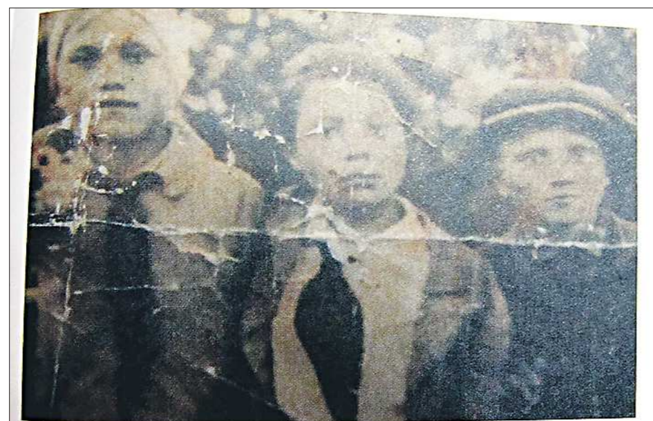
Первые пионеры села Травянского, середина 1930-х годов. К стр. 6.