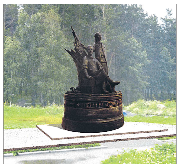
Скульптура изображает военного врача и медсестру на фоне расщеплённого дерева. Композиция будет выполнена из бронзы, её высота составит 4,5 метра (пока готов только пластилиновый макет памятника)

Ориентировочный срок открытия памятника — начало мая нынешнего года, в канун 70-летнего юбилея победы в Великой Отечественной войне.