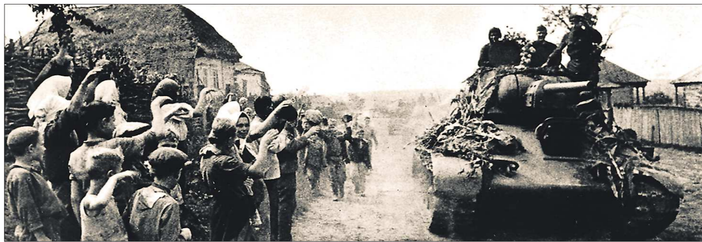
Освобождение Украины. 1943 год