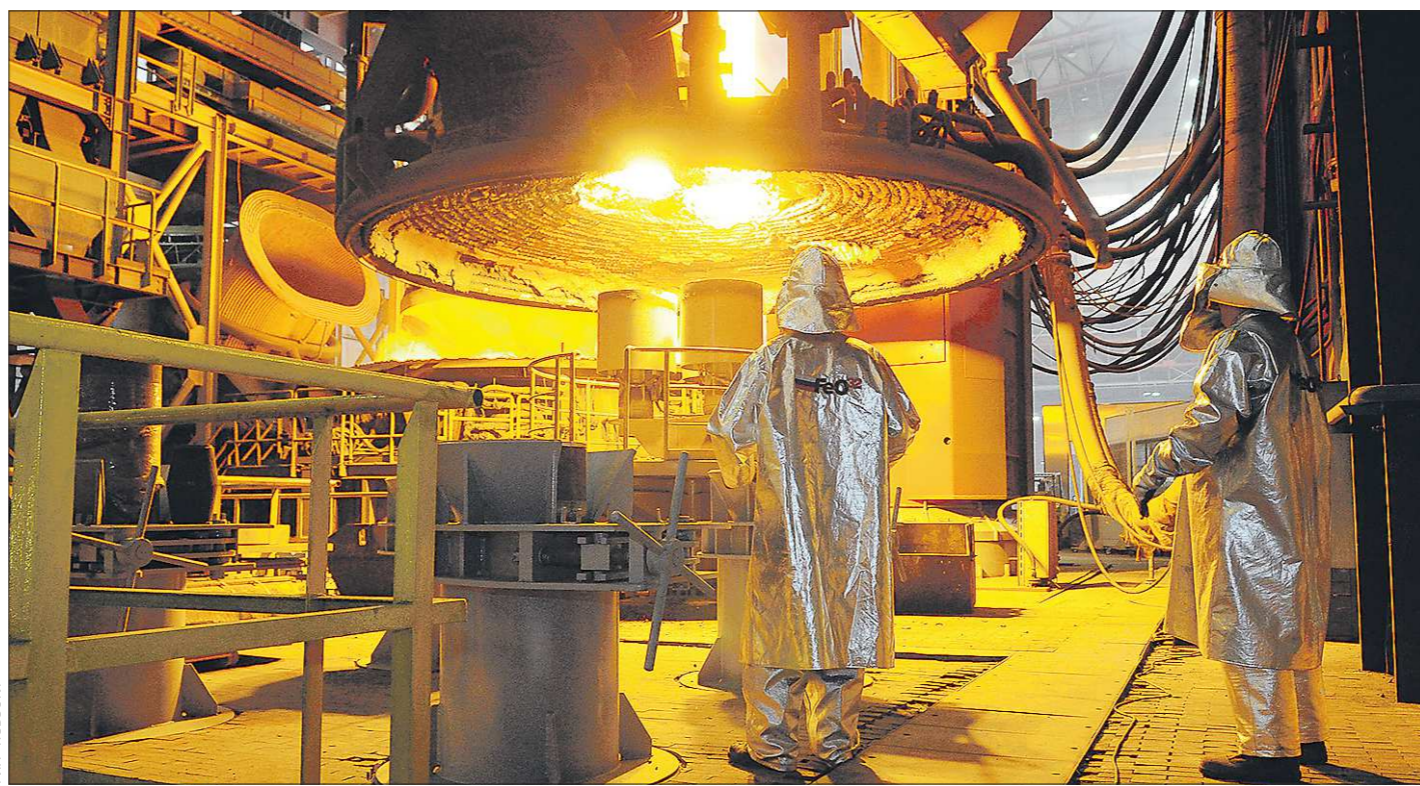
Первоуральский новотрубный завод, где активно внедряется так называемая белая металлургия, — один из примеров инновационного типа предприятий

Новый федеральный закон, который вступит в силу в июле этого года, принят для того, чтобы в стране стартовала масштабная модернизация отечественных заводов, основная цель которой — вернуть российскую экономику от сырьёвого типа развития к инновационному