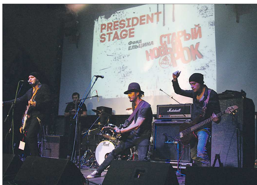
Вчера в Екатеринбурге на площадке ДК «Урал» прошёл традиционный (16-й по счёту) фестиваль «Старый новый рок». В нём приняли участие сразу 10 хэдлайнеров и около 30 молодых рок-групп со всей России. Большой репортаж — в завтрашнем номере «ОГ»