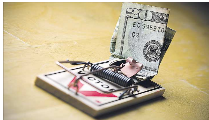
Оформляя кредит в валюте, люди и не думали, что через пару лет окажутся в капкане

В декабре Общество защиты прав потребителей (ОЗПП) обратилось в Центробанк и правительство РФ с предло-