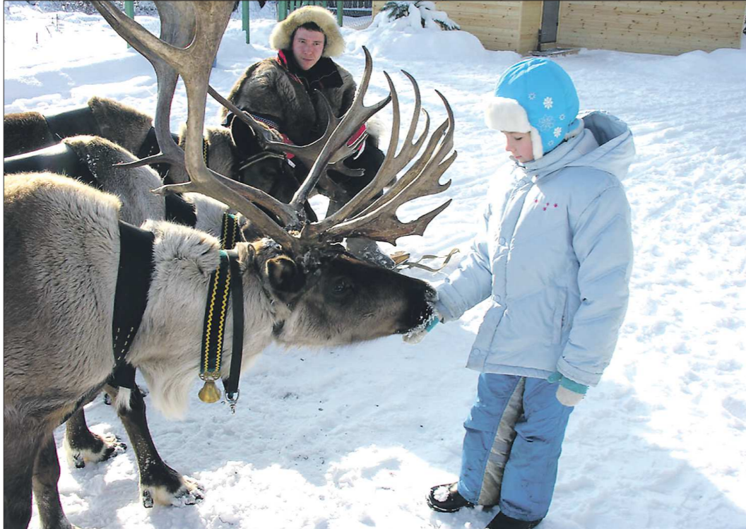
Поблизости с настоящими северными оленями и прокатиться в санях можно в Уральской резиденции Деда Мороза на Уралмаше в Екатеринбурге и в Сысерти. Плата за катание — от 300 рублей

— Абсолютное большинство заявок мы приняли ещё осенью, когда скачков доллара не было, — поясняет пресс-секретарь ЦК «Урал» Татьяна Иргалева. — Праздник предприятия планируют заранее, отказов от мероприятий у нас практически не было.