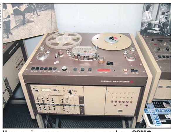
На студийном катушечном магнитофоне СЗМФ М33-205 записывались многие мелодии, оцифрованные теперь «Архитекой»