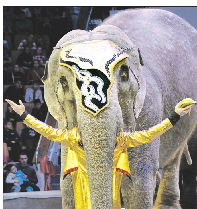
«В екатеринбургском цирке создали два вируса»