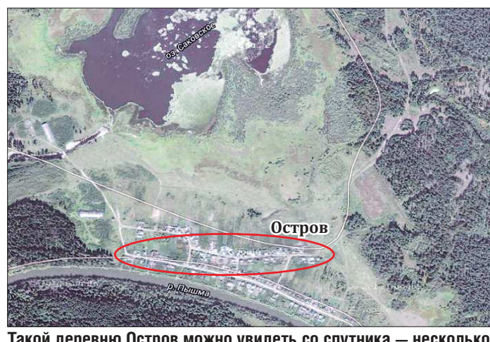
Такой деревню Остров можно увидеть со спутника — несколько десятков домов в окружении леса

— На Острове я родился и уезжать отсюда не планирую. Лавкой занимаюсь давно, надо же людям кормить. Возу продукты из Тюмени, беру самое