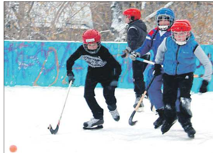
Хоккейные матчи дворцовых команд в Полевском отныне не редкость

завод подарил детям хоккейные ворота. Теперь ребята регулярно устраивают там дворцовые матчи.