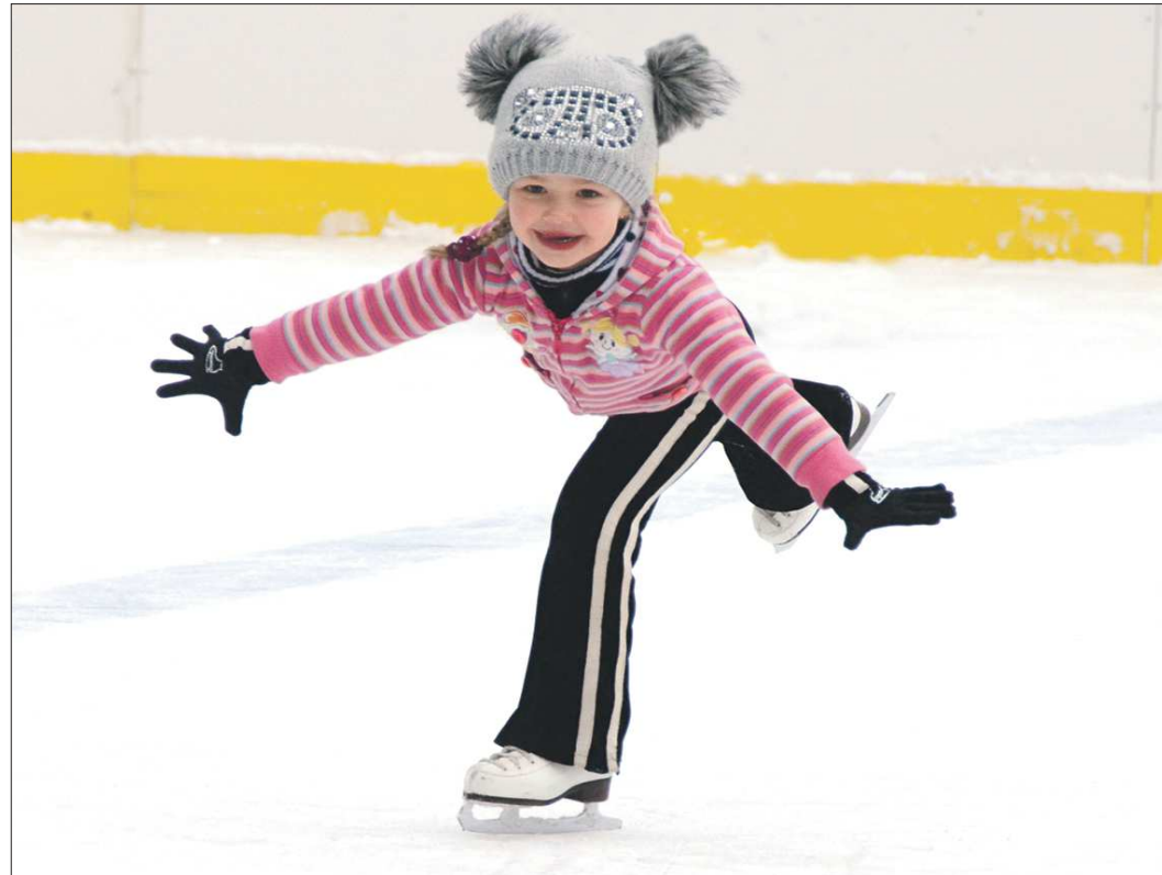
Новый корт в Бобровском сразу оценили даже самые маленькие сельчане. Кто знает, быть может, перед нами новая Юлия Липницкая?

64-я пожарная часть из Полевского решила не отставать от коллег и тоже помогла восстановить ледовую площадку. Они залили корт в Ялунином микрорайоне, а местная коммунальная компания привела в порядок ограждение и расчистила снег. Не осталось в стороне и градообразующее предприятие — Северский трубный